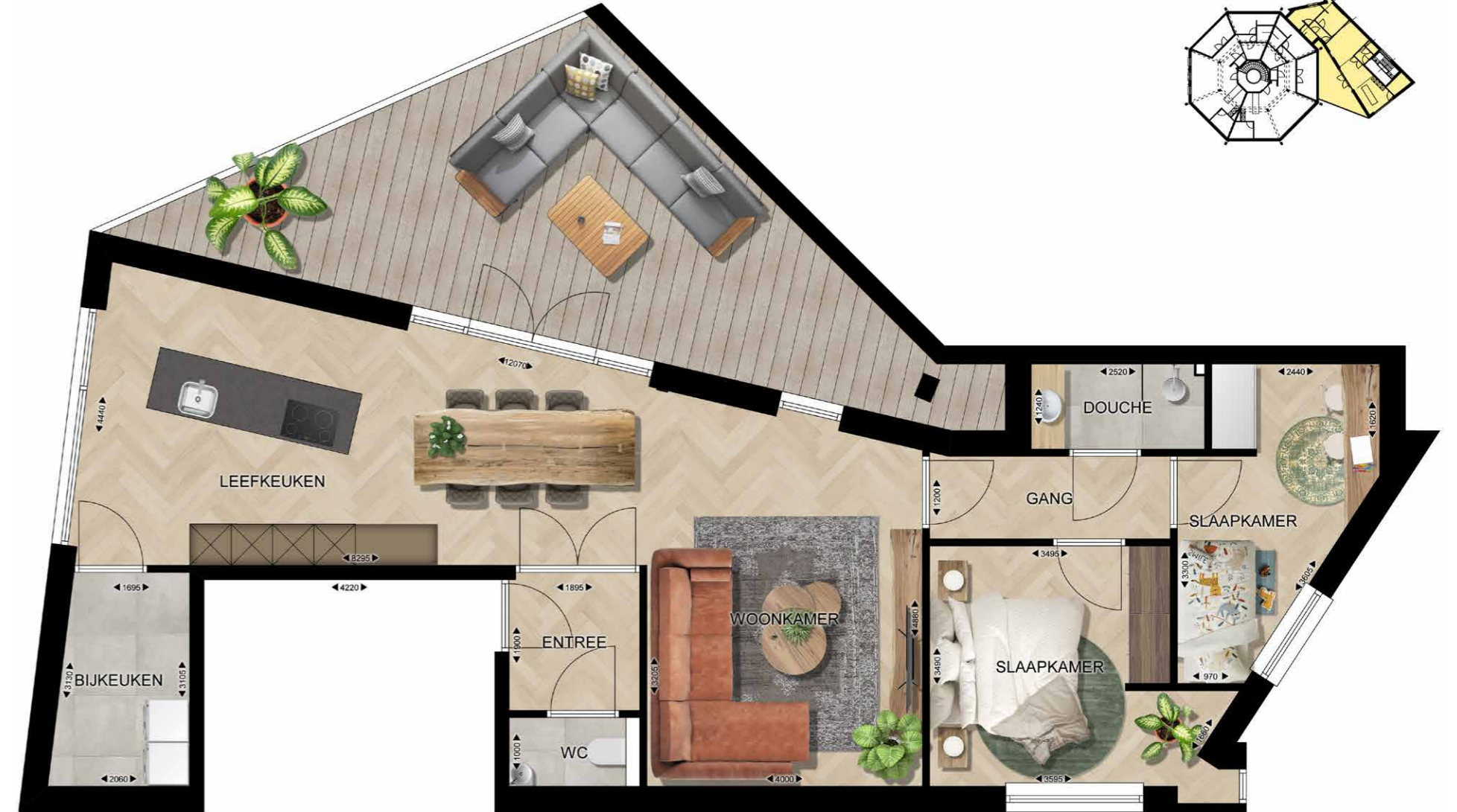
EINDHOVEN FREDERIK HENDRIKPLEIN 35 APPARTEMENT 06 | VERDIEPING