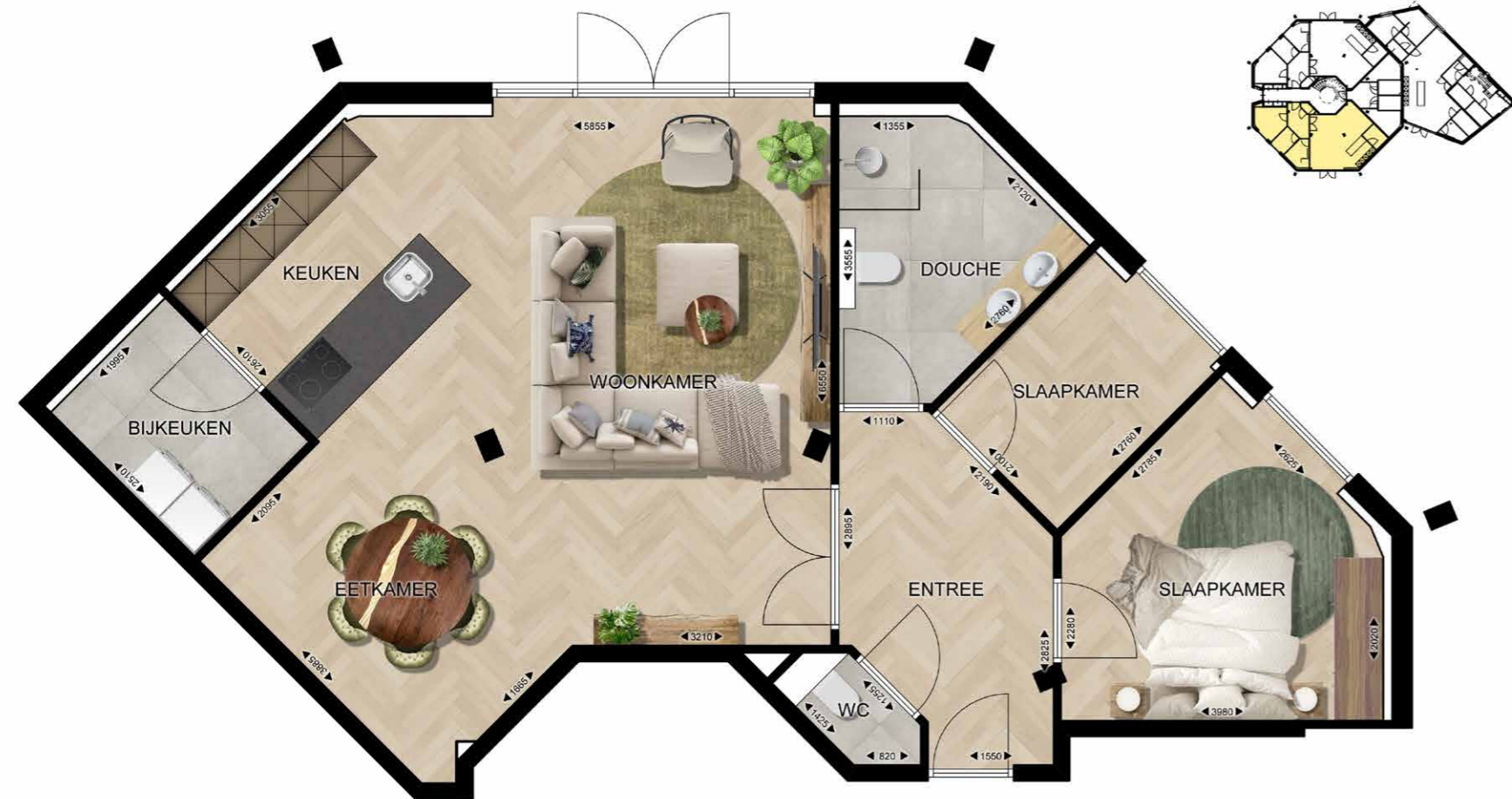
EINDHOVEN FREDERIK HENDRIKPLEIN 35 APPARTEMENT 01 | BEGANE GROND