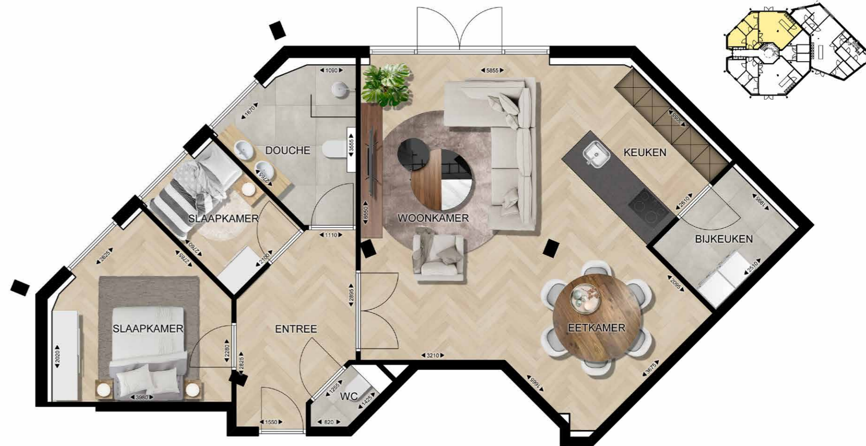
EINDHOVEN FREDERIK HENDRIKPLEIN 35 APPARTEMENT 02 | BEGANE GROND