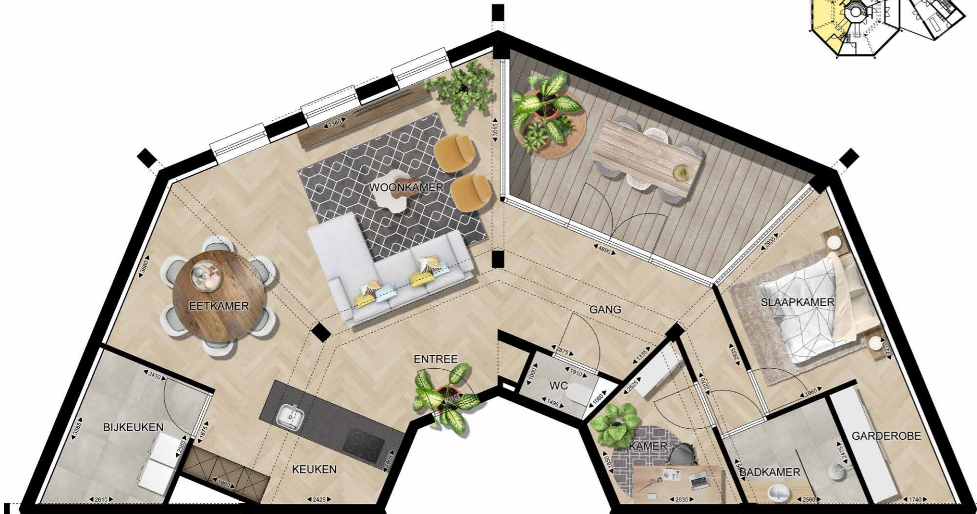
EINDHOVEN FREDERIK HENDRIKPLEIN 35 APPARTEMENT 05 | VERDIEPING