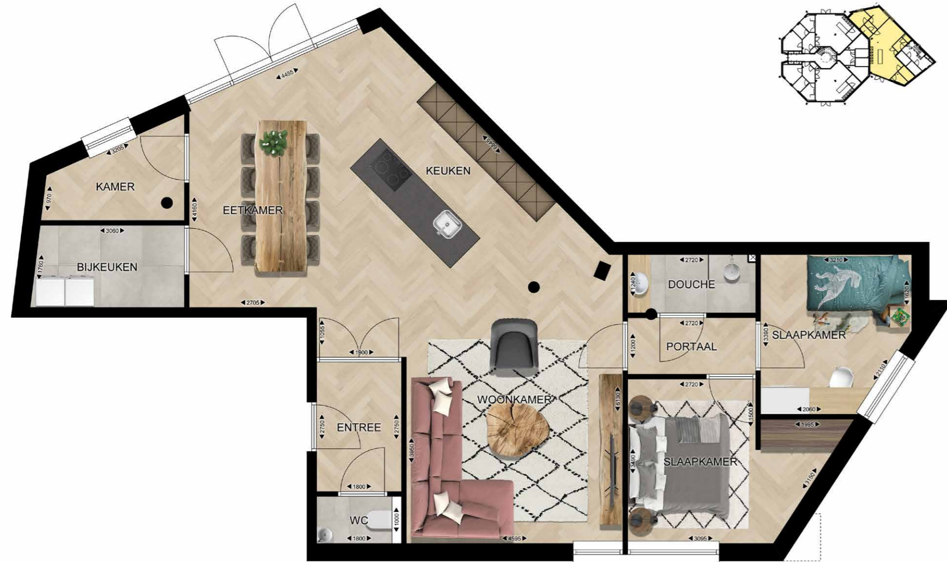
EINDHOVEN FREDERIK HENDRIKPLEIN 35 APPARTEMENT 03 | BEGANE GROND