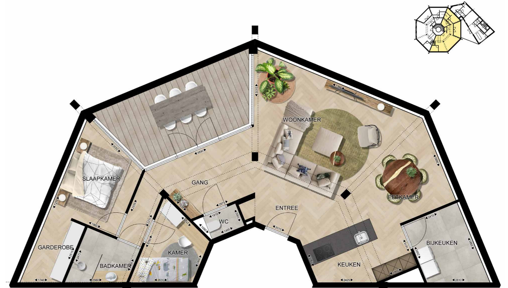
EINDHOVEN FREDERIK HENDRIKPLEIN 35 APPARTEMENT 04 | VERDIEPING